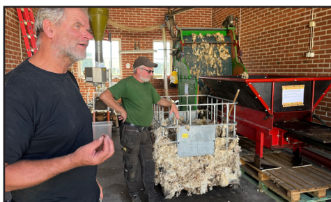
Utveckling av jordförbättrande pellets av spill från ullproduktion i Endre.