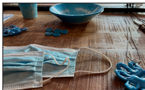
Gotland Garbage – utveckling för produktion av återvunnet material.