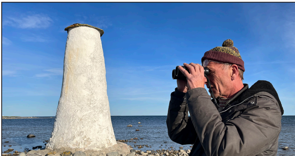
Ovan: Renovering av Langård kummel.

Här presenteras exempel på några olika projekt av vitt skilda slag som fick stöd från Leader Gute under förra programperioden, 2014-2022. Den gemensamma nämnaren för projekten är lokalt ledd utveckling på Gotlands landsbygder.