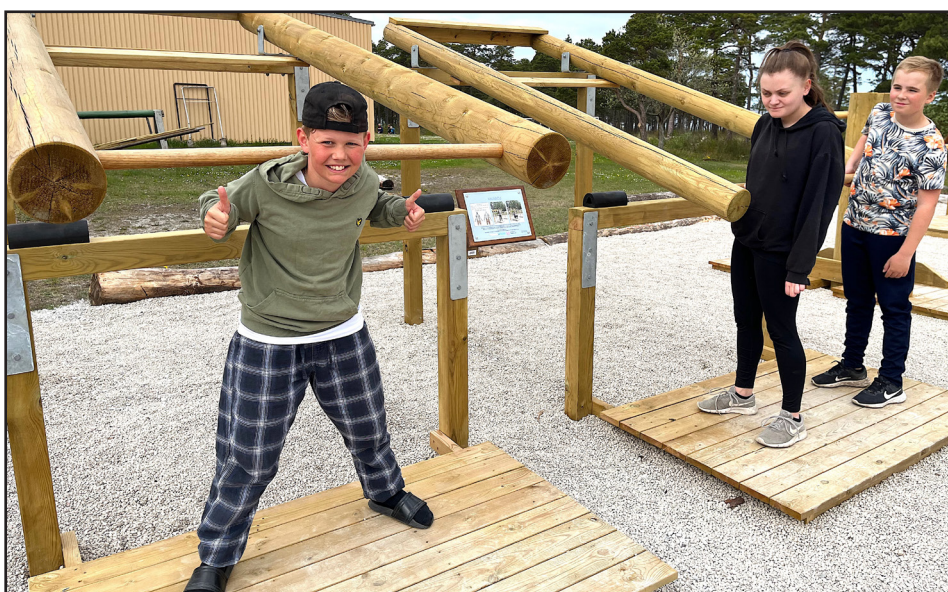
Till vänster: Gympark med mountian-bikebana i Färösund.