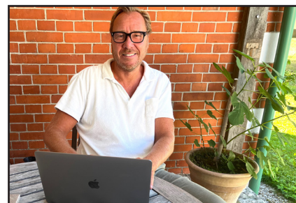
Easy Arr – app för lokala evenemang.