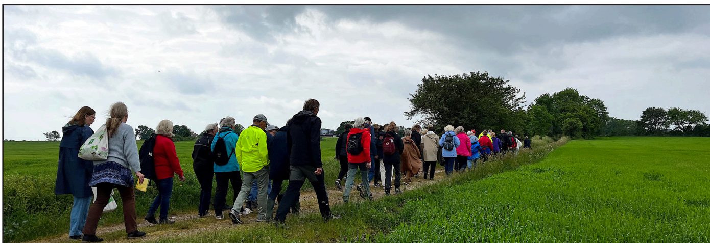
Vandringsled i Stenkyrka socken.